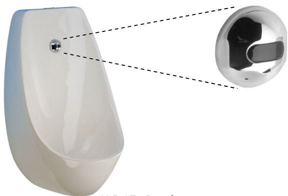
SLP 17 - Domino